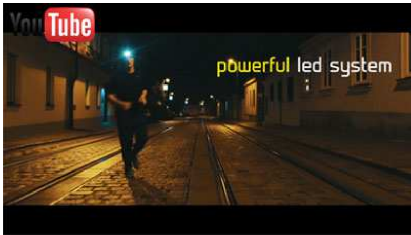
Produktpräsentation / 30 Sek.