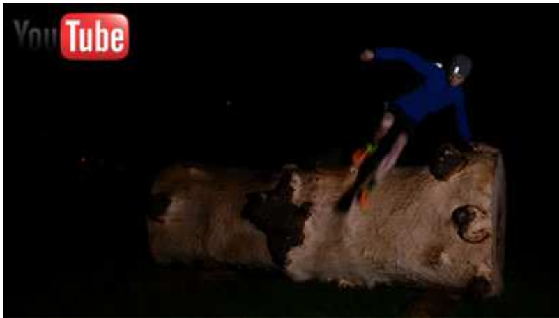
LUMA Grazathlon / 60 Sek.