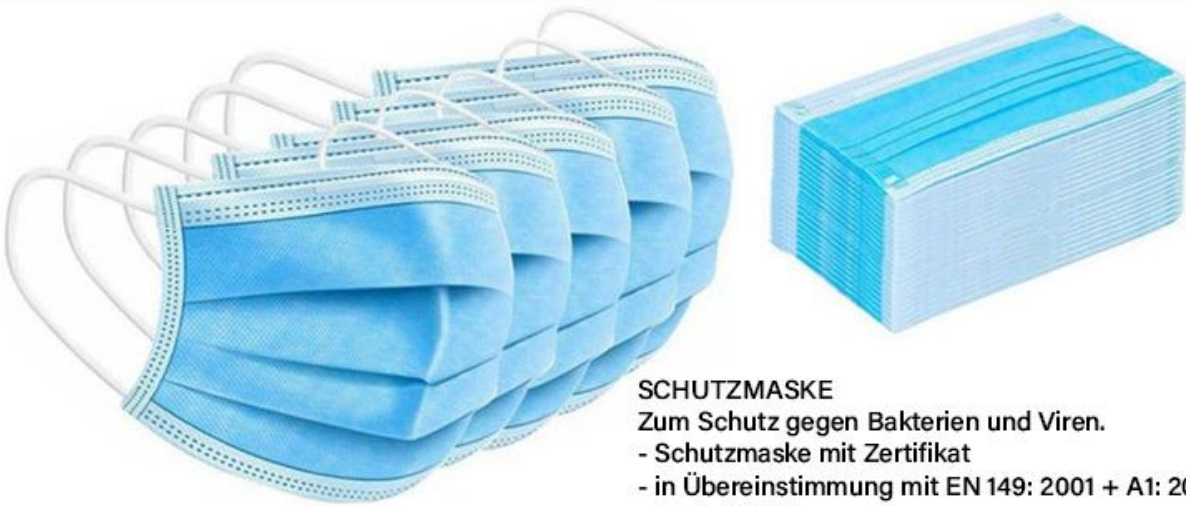
Platinet Einweg-Schutzmaske Mehrfachpackung 50 Stück